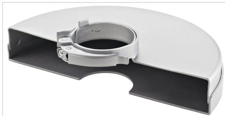
Slijpbeschermkap geschikt voor L 21-6/L 24-6/L 26-6 230.